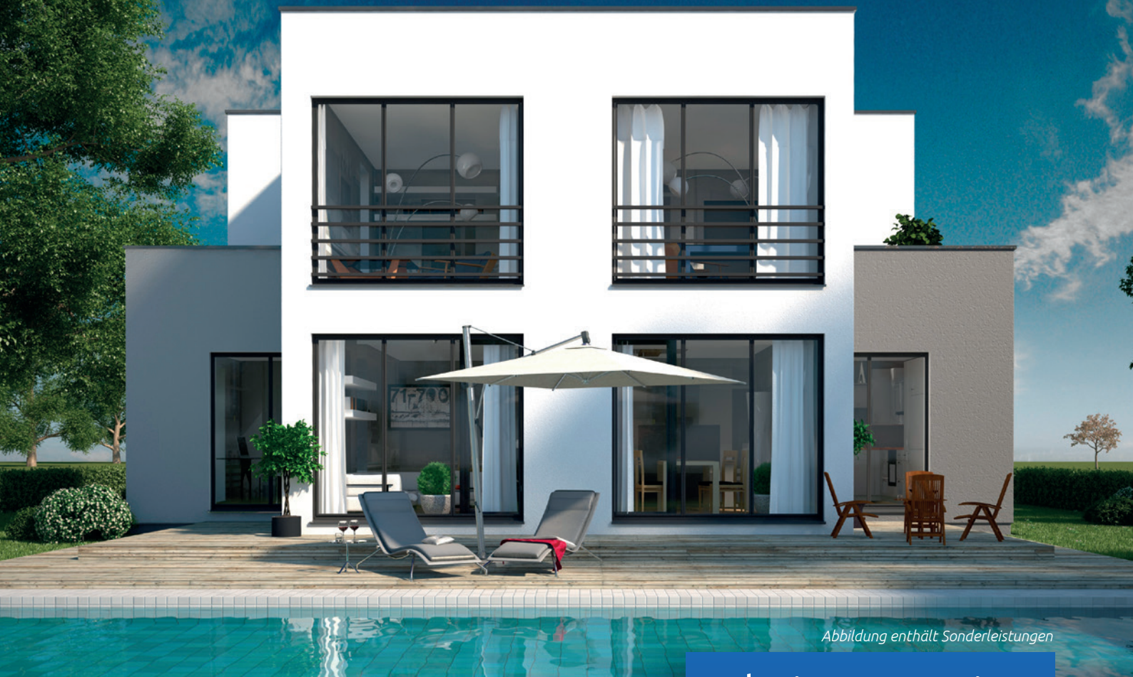
Abbildung enthält Sonderleistungen