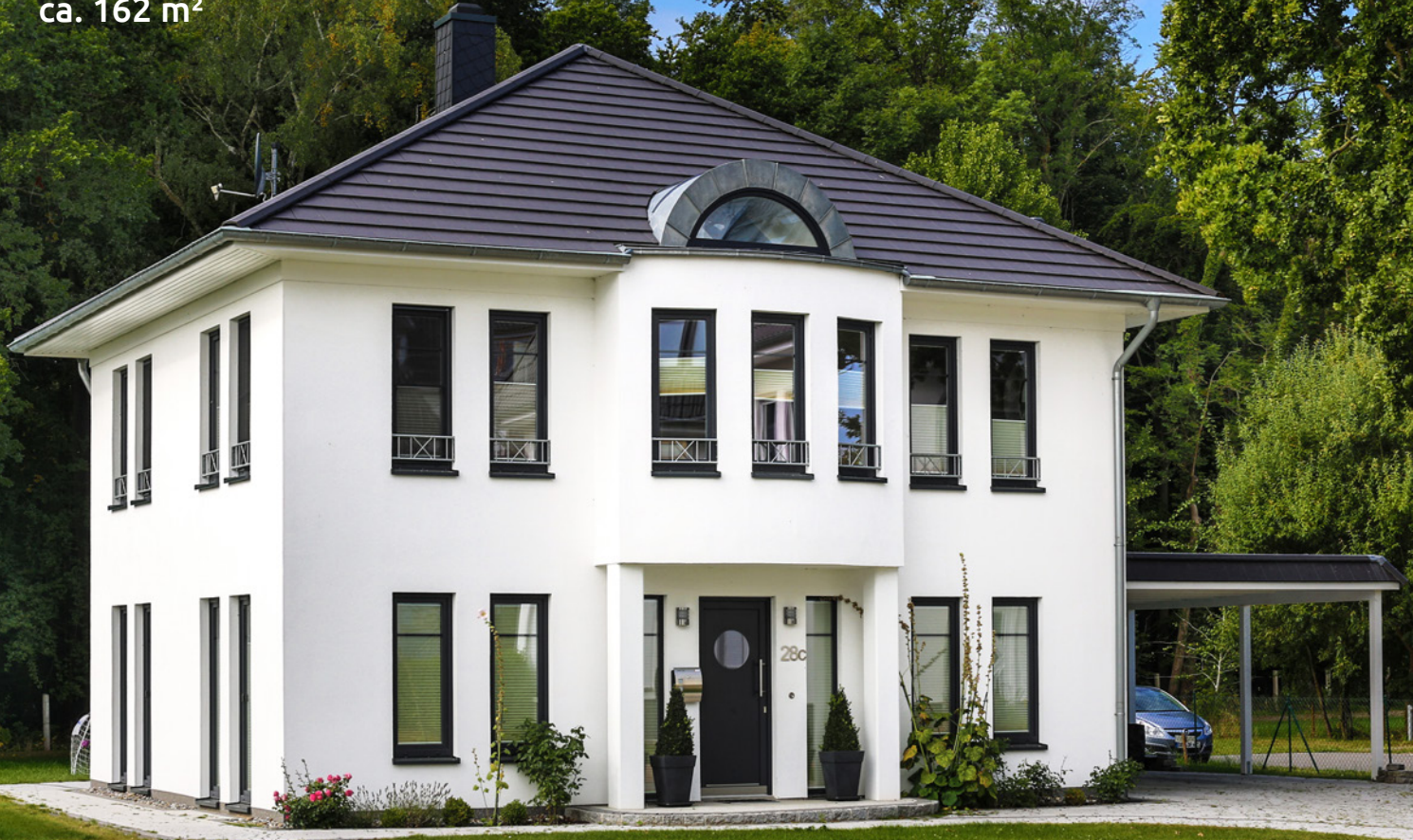
Abbildung enthält Sonderleistungen