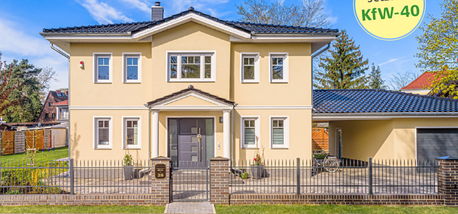
Abbildung enthält Sonderleistungen